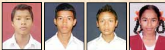
ಛಂಭಾರ್‌ಷಾಯೋ ಬಿಷಾರ್‌ಲಾಂಗ್ ಸೆಲ್ವಿಸ್ವರ್ ರಂಜಿತಾ

8ನೇ ತರಗತಿಯ ವಿದ್ಯಾರ್ಥಿಗಳಿಗೆ ಒಂದು ದಿನದ ಪ್ರವಾಸವನ್ನು ವೇಣೂರು ಮಹಾಲಿಂಗೇಶ್ವರ ದೇವಸ್ಥಾನ, ಕಾರ್ಕಳ ಬಾಹುಬಲಿ ಮೂರ್ತಿ, ಮೂಡಬಿದಿರೆಯ ಸಾವಿರ ಕಂಬ ಬಸದಿ, ಆಳ್ವಾಸ್ ಶೋಭವನ, ಕೊಡ್ಯಡ್ಡದ ಅನ್ನಪೂರ್ಣೇಶ್ವರಿ ದೇವಸ್ಥಾನ, ಪಿಲಿಕುಳ ನಿಸರ್ಗಧಾಮ - ಮೈಗಾಲಯ ಹಾಗೂ ನಂದಿನಿ ಹಾಲು ಸಂಸ್ಕರಣಾ ಘಟಕಕ್ಕೆ ಹಮ್ಮಿಕೊಳ್ಳಲಾಗಿತ್ತು. 32 ವಿದ್ಯಾರ್ಥಿಗಳು ಮತ್ತು 5 ಶಿಕ್ಷಕರು ಭಾಗವಹಿದರು.