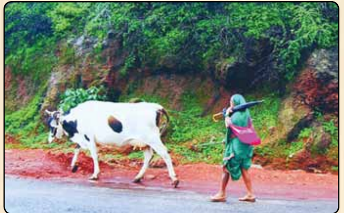
ಈ ಚಿತ್ರಕ್ಕೆ ಶೀರ್ಷಿಕೆಯನ್ನು ಕಳುಹಿಸಿಕೊಡಿ. ವಿದ್ಯಾರ್ಥಿಗಳು ಆಯಾ ವಿಭಾಗದಲ್ಲಿ ಇಟ್ಟಿರುವ ಸರಯೂ ಪೆಟ್ಟಿಗೆಯಲ್ಲಿ ಉತ್ತರಗಳನ್ನು ಬರೆದುಹಾಕಿ.