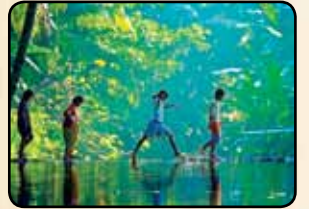
ಓಂದಿನ ಸಂಚಿಕೆಯ ಚಿತ್ರಕ್ಕೆ ಆಯ್ಕೆಯಾದ ಶೀರ್ಷಿಕೆಗಳು :