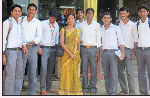
ವಿದ್ಯಾರ್ಥಿಗಳು ಭಾಗವಹಿಸಿದ್ದು ಫುಡ್‌ಗೋ ಆಗ್ಲೋ ಕಂಪೆನಿ, ಉಲ್ಟಾಸ್ ಐಸಕ್ರೀಂ ಕಂಪೆನಿ, ಯಜಮಾನ ಇಂಡಸ್ಟ್ರೀ, ಶ್ರೀ ಕೃಷ್ಣ ಬ್ರಿಕ್ಸ್ & ಟೈಲ್ಸ್ ಫ್ಯಾಕ್ಟರಿ, ಸೋಮಾಯಾಜಿ ಫರ್ನಿಚರ್ & ಐರ್ನ್ ಇಂಡಸ್ಟ್ರೀ,

ಸರಸಿಜಾ ಫುಡ್ ಕಂಪೆನಿಗಳಿಗೆ ಭೇಟಿ ಇತ್ತು ಕಂಪೆನಿ ಸಮಗ್ರ ಅಧ್ಯಯನ ನಡೆಸಲಾಯಿತು.