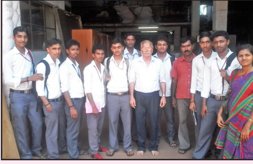
ಅಂತಿಮ ವಿಭಾಗದ ವಿದ್ಯಾರ್ಥಿಗಳಿಗಂದು ಯೋಜನಾ ಕಾರ್ಯ ಆಯೋಜಿಸಲಾಗಿತ್ತು. ಒಟ್ಟು 84